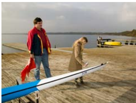
Båddøb ved standerstrygningen 2007

Stk. 4. Rettidigt indkomne forslag til den ordinære generalforsamling skal offentliggøres ved opslag i klubben umiddelbart efter modtagelsen.